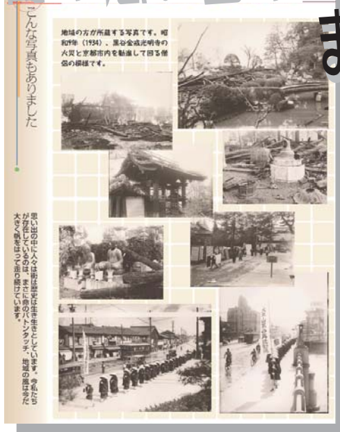
集めた写真を思い出とともに1枚のパネルに