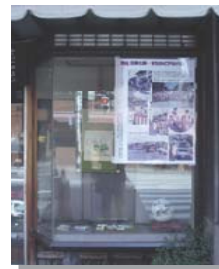
まちかどで展示すれば、まち全体が展示会場