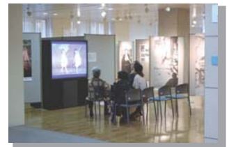
パネルや映像にした写真で展示会