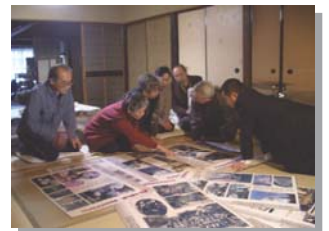
作成したパネルを囲んで座談会