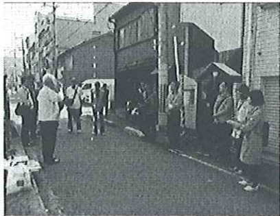
■25名がまちあるきに参加■

当日は自主防災会を中心とした地域住民に加え、東山区役所、東山消防署、京都市景観・まちづくりセンター、京都市、コンサルタントの総勢25名がまちあるきに参加しました。まちあるきでは、路地の道幅を図ったり、路地奥の行止まりの状況を調査するとともに、お住まいの方々の協力も得て、地域の安全性の向上に向けた路地対策の必要性を共有しました。