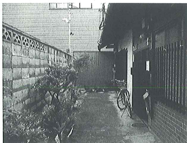
例3：自転車も片隅に寄せられ、植栽も適正に管理されており、路地の安全で快適な通行ができます。