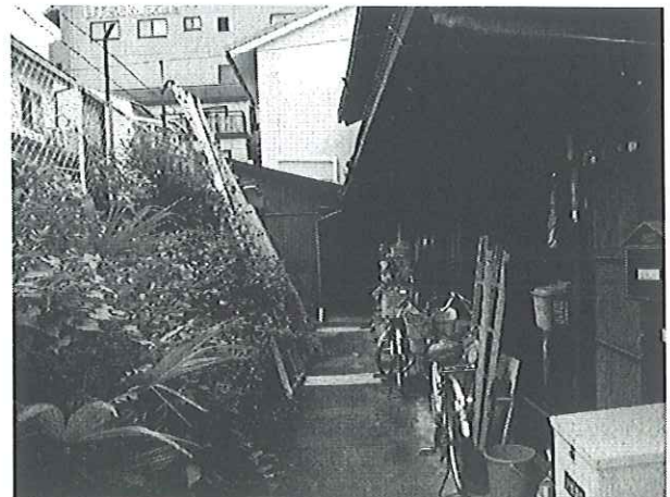
例2：万が一の際に、路地に置かれたものが倒れ、路地の通行を妨げる恐れがあります。