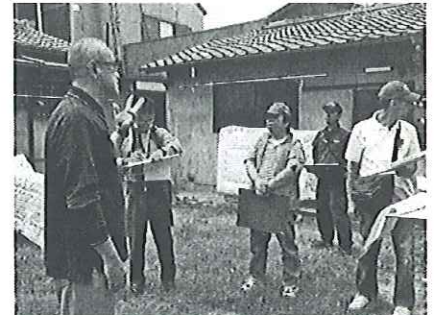
■住民の方々と交えて対策を検討■