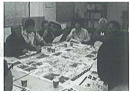
■10月25日の防災会議風景■