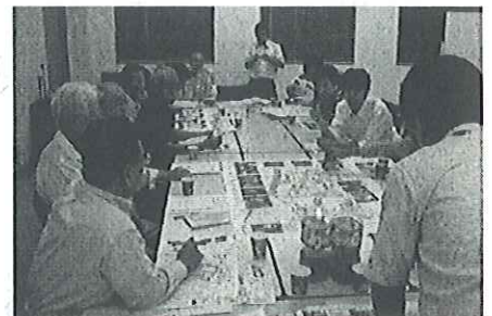
■10月3日の防災会議風景■

今後はその実現に向けて、住民のみなさまのご理解とご協力のもと、具体的な対策を進める予定です。