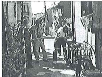
■路地の幅をメジャーで計測■