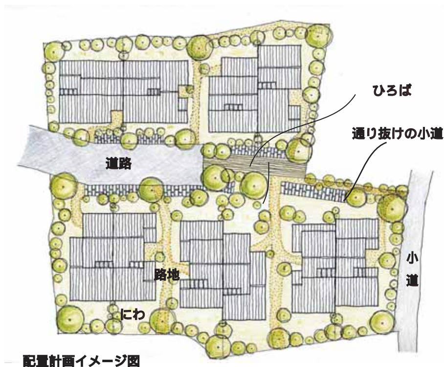
配置計画イメージ図